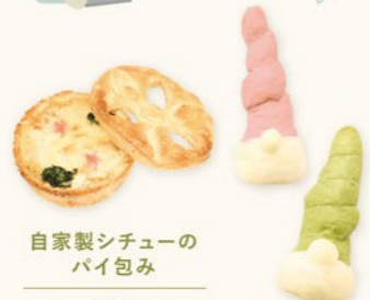
自家製シチューの パイ包み