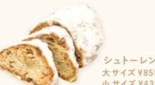
シュトーレン 大サイズ ¥855 小サイズ ¥435

今年も家族みんなでクリスマスパーティーの準備をはじめます!毎年人気の『シュトーレン』、今年は更に美味しく仕上がりました。サルタナレーズン、レモンピール、くるみ、アーモンド等をラム酒でじっくり漬け込み、マジパンと練り込みました。クリスマス本番は、テーブルにチキンやピザ、ケーキなどが次々と並びます。『クリームブロッコリーピザ』はフォカッチャ生地に旬のブロッコリーをたっぷり使用し、ベーコン、プチトマト、コーンを乗せ、彩り良く仕上げました。他にも今月のテーマに合わせたパンなどを多数をご用意しております。ぜひお試しください。