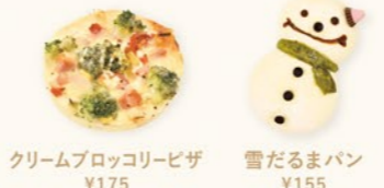
クリームブロッコリーピザ ¥175