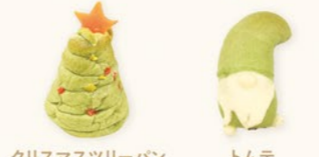
クリスマスツリーパン ¥175