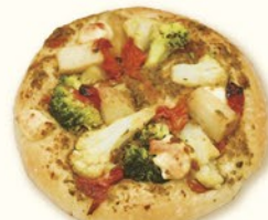
ベジフォカッチャ

手紙に見立てたパンの中にマーボー風に炒めた鶏のミンチがたっぷりに入ったボリューム感のあるサンドです。(¥200)