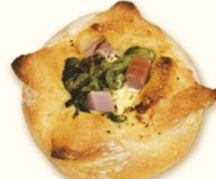
菜の花とベーコン

たっぷりの野菜とクリームチーズがのったフォカッチャ。ソースはジェノベーゼにピザソースを混ぜ深みのある味わいに。(¥180)