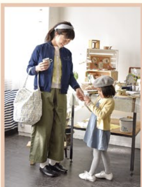
ノースオブジェクトプチ 春のおすすめコーデ