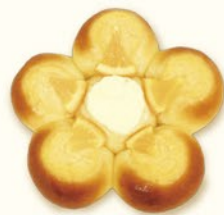
オレンジフラワー

菓子生地で作った花びらにはカスタードとオレンジ、中央にはクリームチーズをのせた見た目も味も楽しめるパンです。(¥140)