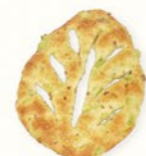
そら豆のフーガス ¥140